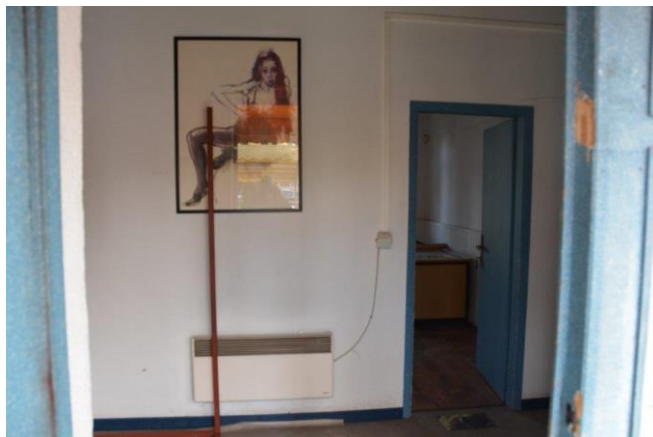
Slika 6: PRETPROSTOR, ODNOSNO HODNIK 3,6*2 m